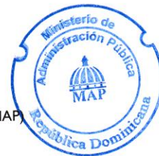
Lic. Sigmund Freund Mena Ministro del Ministerio de Administración Pública (MAP)